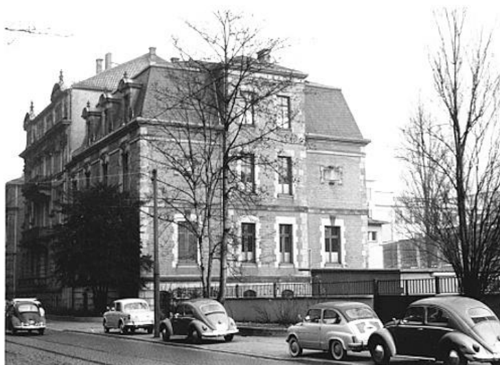
Oppenheim-Villa Reuterweg 32 um 1961 nach Umbauten.